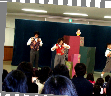
劇団風の子の皆さん