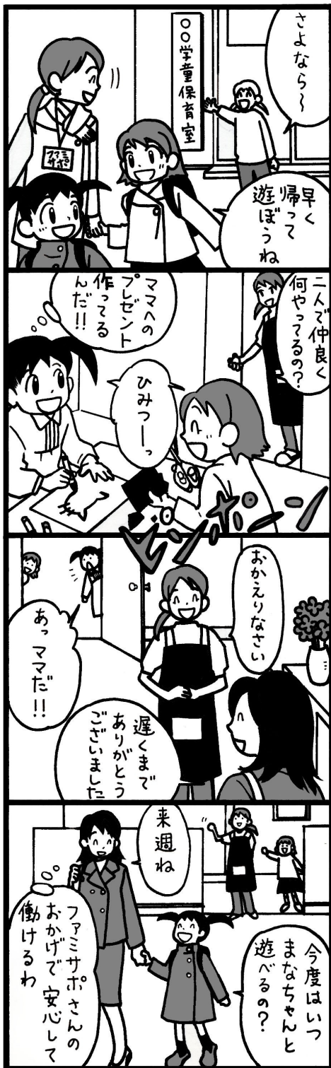
子どもも楽しくママも安心ね!