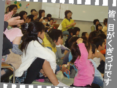
皆、目がくぎづけです