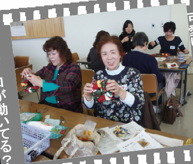
可愛いリースの完成です