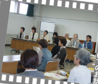
視覚障害についてのお話