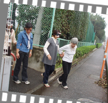
五感をフルに使います