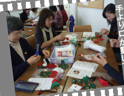
手より口が動いている？