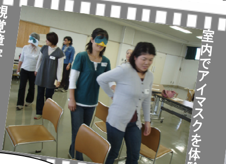
室内でアイマスクを体験