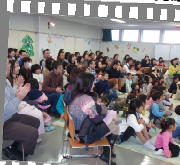
親子で一緒に大笑い