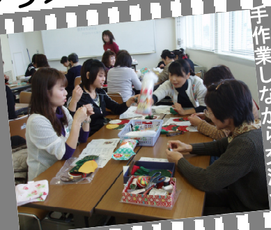
手作業しながら交流会